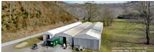
Lachszenrum vor der Staumauer.