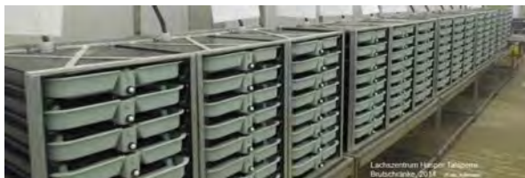
Brutschränke (2014).