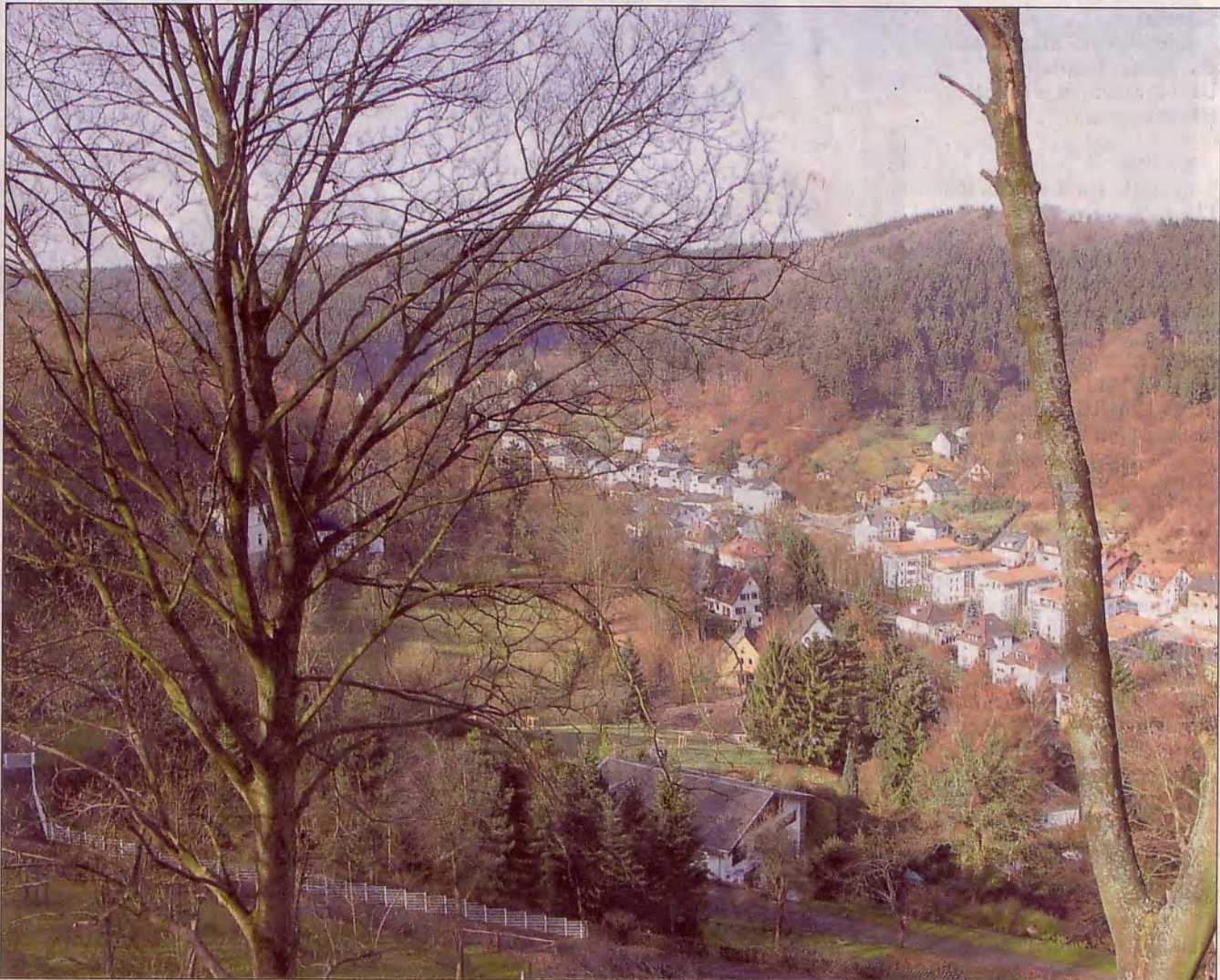
Blick ins Wesselbachtal mit der Wohnbebauung auf dem ehemaligen Kritzler-Gelände und dem ehemaligen Gelände der Friedrich-Gustav-Theis Kaltwalzwerke GmbH.