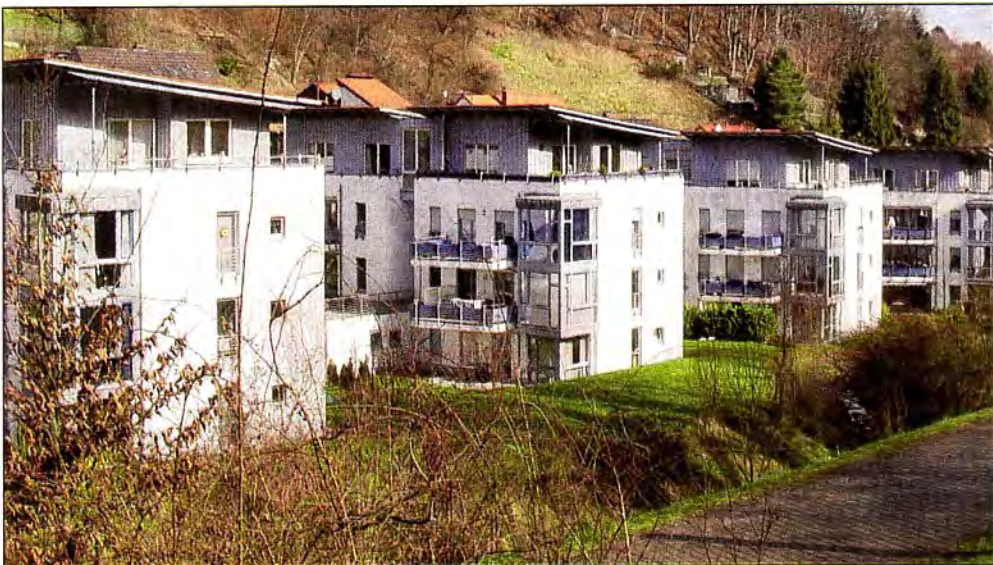
Die individuell gestaltete Wohnbebauung auf dem ehemaligen Kritzler-Gelände wurde von der CASA GmbH erstellt. Ein städtebaulicher Wettbewerb wurde dazu zuvor veranstaltet.